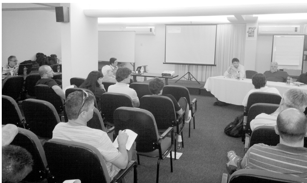
Diretores dos sindicatos da Intersul e Intercel escutam relato do Representante dos Empregados no Conselho da Tractebel